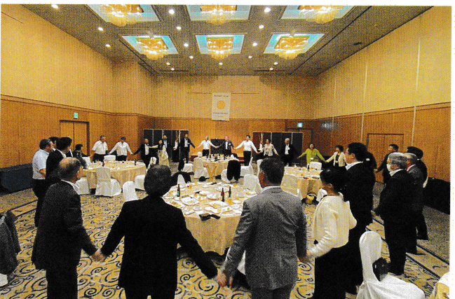
“手に手つないで”の大合唱